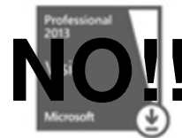
Microsoft Visio 2013