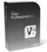
Microsoft Visio 2010