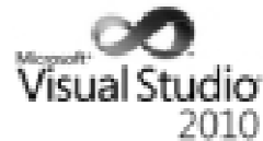
Microsoft Visual Studio 2010

Esiste anche una versione Express più 'leggera' – scaricabile gratuitamente dal sito MS